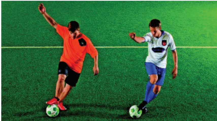
Neue motorische Herausforderungen machen die Spieler flexibler.